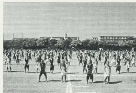
カラーアトラクションでのパフォーマンス

6月に体育祭が行われました。圧巻だったのはカラーアトラクションで、3つの色に分かれた全校生徒が集団でパフォーマンスを競いました。体育祭終了後、生徒達は部活動の試合に全力で戦い、陸上部・水泳部が全国大会で活躍、かるた部は全国8位、音楽部は全国大会を制しました。そして今、部活動を引退した3年生は、進路実現に向けて夏の補習に励んでいます。西高の生徒は、行事にも、部活動にも、勉強にも一生懸命で、二兎も三兎も追う欲張りな生徒です。現在西高は新しい校舎に建替え中で、大庭の大地に開校して40年。西高校は、新しい校舎に多くの欲張りな生徒が集う学び舎となります。