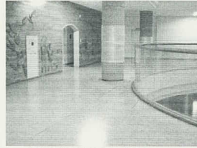
石川小学校内のオープンスペース

20数年前、地域の方に水田や農機具、乳牛、近くの神社について説明していただき、写生会を開いたことがあります。子どもたちは皆、本物を間近にして集中して描いていました。それは、本物の力によることです。本校においても自然や文化を教材として取り入れ、また、隣接している工場や地域の方々にご協力を願ひ、活動の充実を図りたいと考えています。多様に活動できる広々としたスペースを地域学習のまとめや発展に活用しながら、感性豊かに学び、地域を愛する子どもたちがあふれる学校づくりをめざしたいと思ひます。