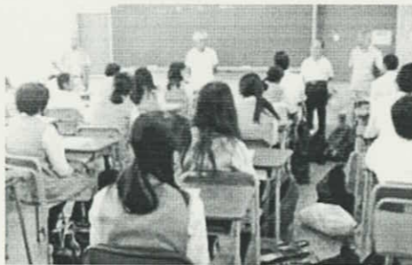
地域の皆様をお招きして

公立学校ですので、地域のお子さんを「地域の方々のご協力を得ながら教育していきたい」と考えています。昨年度より、自治会ごとに集団で生徒を下校させる訓練に加え、「地域自治会の防災リーダーや自治会役員と生徒たちが顔合わせする場」を設け、「地域におけるネットワークづくり」として本校ができることを実施しています。全51自治会の内、当日は、数十人の自治会の方々にお越しいただき、生徒と交流を深めました。